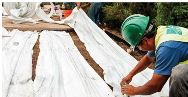
Пример установки Eco-Mat